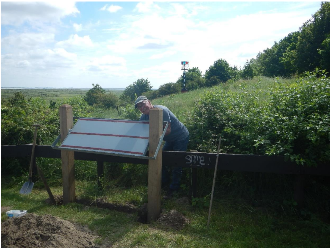
Krijn bezig met het informatiebord