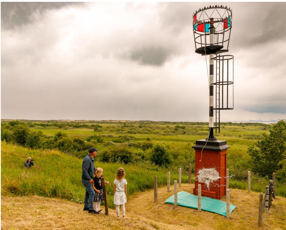
Het lichie ten doop