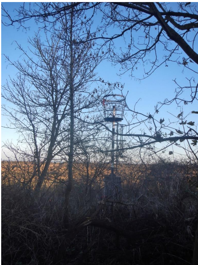
Het lichie in 2021, geheel overwoekerd door opwas.