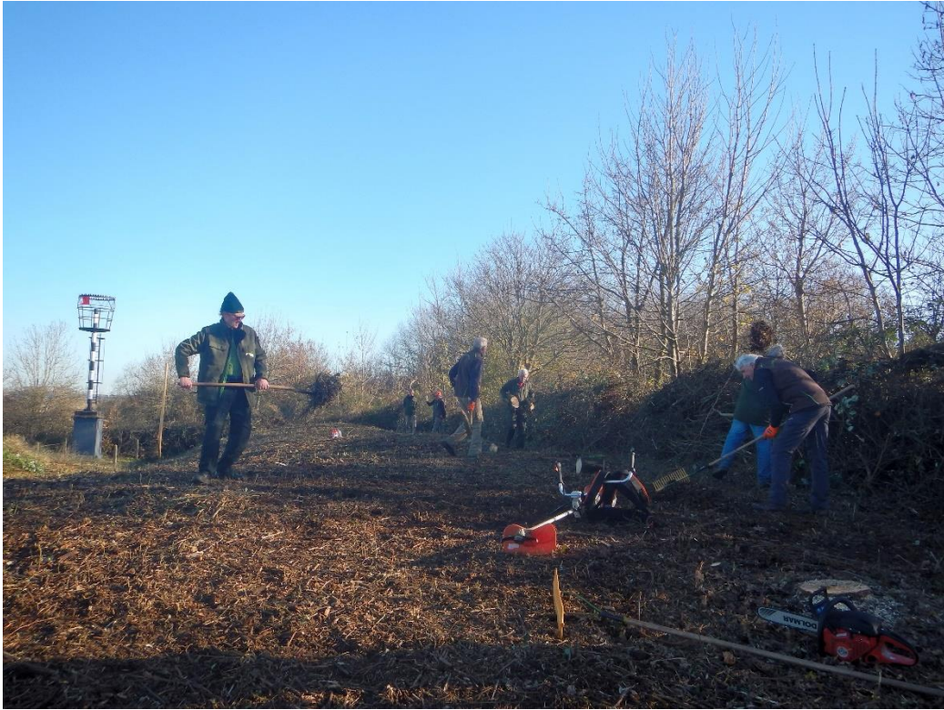
De oude zeewering en 't lichie weer zichtbaar.